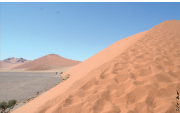
Désert du Namib (Namibie).

Plus grandes villes : Le Caire, Lagos, Pretoria-Johannesburg, Kinshasa, Abidjan, Casablanca, Alger, Dakar, Tunis.