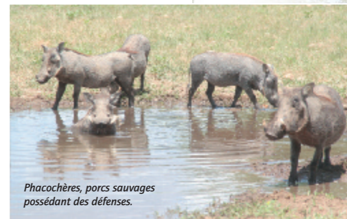
Phacochères, porcs sauvages possédant des défenses.

Du XV e au XIX e siècle, la traite des esclaves arrache des millions d'hommes à l'Afrique pour les conduire vers le Nouveau Monde. Jusqu'en 1850, les tentatives de colonisation européennes en Afrique noire sont encore isolées – Français au Sénégal, Anglais en Gambie et Hollandais dans la région du Cap – mais dès la seconde moitié du XIX e siècle, l'Afrique devient l'enjeu d'une compétition entre les puissances européennes et, au début du XX e siècle, la quasi-totalité du continent est partagée entre la France, la Grande-Bretagne, le Portugal, la Belgique, l'Espagne, l'Allemagne et l'Italie. Après la Seconde Guerre mondiale, un mouvement d'émancipation naît d'abord au Maghreb puis s'étend bientôt sur toute l'Afrique occidentale et centrale.