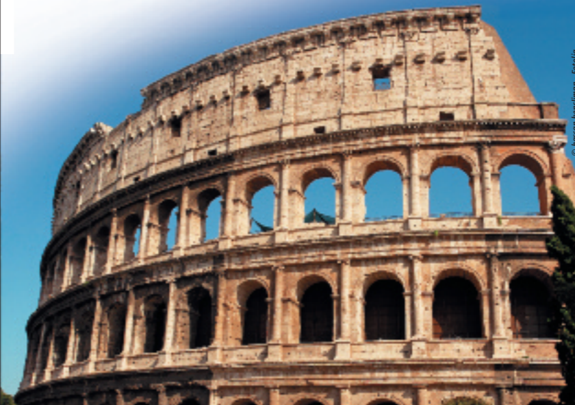
Le Colisée, grand amphithéâtre construit à Rome au 1 er siècle de notre ère.

Néanmoins, aujourd'hui, plus de 50 % des Italiens parlent encore peu ou prou leur dialecte natal, selon les circonstances ; c'est la langue que l'on parle en famille, entre amis, celle des comptines. On remarque par ailleurs que, dans certaines régions, il se maintient bien ; c'est le cas de la Vénétie , du Trentin , du Frioul , de la Campanie et de la Sicile . Par ailleurs, nous devons citer les langues encore vivantes comme l'occitan ( Piémont ), le franco-provençal ( Val d'Aoste ), l'allemand ( Haut-Adige , Frioul ), le slovène ( Vénétie Julienne ), le catalan ( Sardaigne ), l'albanais ( Sicile , Campanie , Calabre , Pouilles ), le grec ( Calabre ), le sarde ( Sardaigne ), le ladin et le frioulan ( Frioul , Vénétie ).